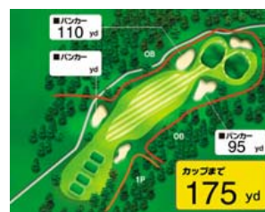
【プレイ中のコース情報】