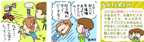
▲「しよーぞーケンってナニ?！」より

中学生の女の子を主人公とし、生活に密接した(ケータイ)ネットマナーやモラルについての問題をテーマに心掛けを啓発していく8コママンガを揃えています。