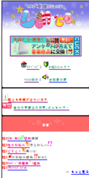
【uchico】トップ画面イメージ

子どもたちに最も身近なメディアで、使い慣れているケータイを通して、遊びながら楽しく勉強できる携帯コンテンツです。利用は全て無料で、会員登録制です。2010年1月現在、会員は60万人に上ります。