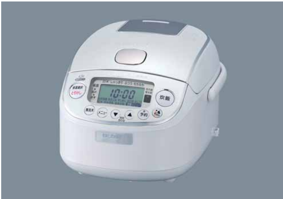
真空内釜圧力IH炊飯ジャー「極め炊き」(NP-RS05型)